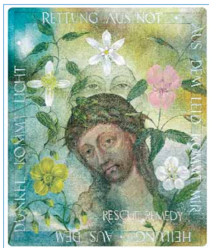
Abb. 1: Rescue-Tropfen

Durch Testen (EAP, Kinesiologie, Resonanztester) kann man feststellen, ob die Narbe und welcher ihrer Abschnitte stört. Dabei spielt die Größe oder Kelloidbildung keine Rolle, oft stören winzige Narben viel stärker als große. Starke Blockaden gehen häufig von Laparoskopie-Narben in der Nähe des Nabels aus, besonders dann, wenn sie auf dem Kon-