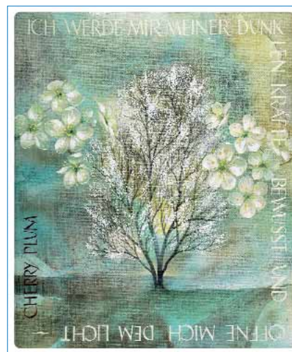
Abb. 2: Cherry Plum

Mit sanftem Druck werden die Bach-Blüten auf der Narbe verrieben. Der Patient hält gleichzeitig die Stirnbeinhöcker und geht mental in die Zeit der Narbenentstehung zurück. Als Symbole setze ich die Hagal-Rune, die Tibetische Acht, die Sinuskurve und zum Schluss das Energiewedeln ein. Anschließend wird nachgetestet. Jetzt muss der Indikatormuskel bei gleichzeitigem Berühren der entstörten Narbe stark bleiben. Die Ener-