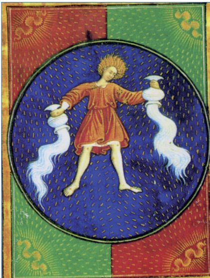
Abb. 2: Wassermannzeitalter: Die Geburt einer neuen Bewusstseinsentwicklung, hin zur höheren Beseelung und zum spirituellen Erwachen ist ein kosmischer Imperativ unserer Zeit.

wicklung hin zur höheren Beseelung ein kosmischer Imperativ ist.